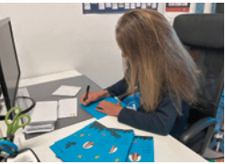
Viele Karten wollen geschrieben und eingetütet werden

Unter dem Titel „Licht und Klang“ lädt die beeindruckende Kreuzkirche am Hohenzollerndamm ein.